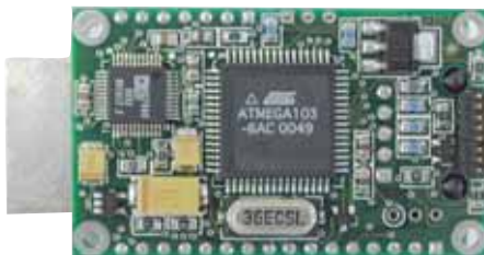
M15HP (dimensioni reali)